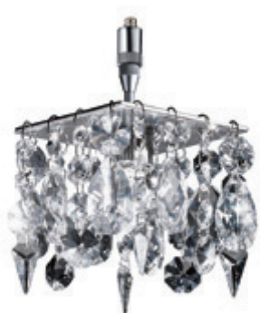
CRISTELLO / DOWN-C SQ PNT lien au produit