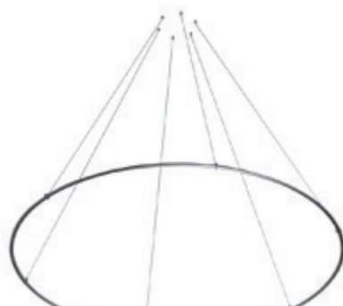
VIA / ANNEAUX lien au produit