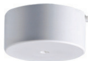
M-TRANSFORMER lien au produit