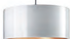
CANTARA GLAS / DOWN PNT blanc, intérieur doré