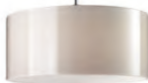
CANTARA GLAS / DOWN PNT crème, intérieur blanc