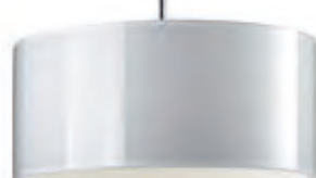
CANTARA GLAS / DOWN PNT blanc, intérieur blanc