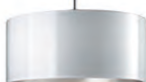
CANTARA GLAS / DOWN PNT blanc, intérieur argenté