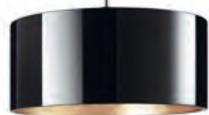
CANTARA GLAS / DOWN PNT noir, intérieur doré

Lumière d'ambiance pour les tables de salle à manger et de conférence