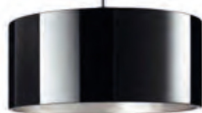
CANTARA GLAS / DOWN PNT noir, intérieur argenté